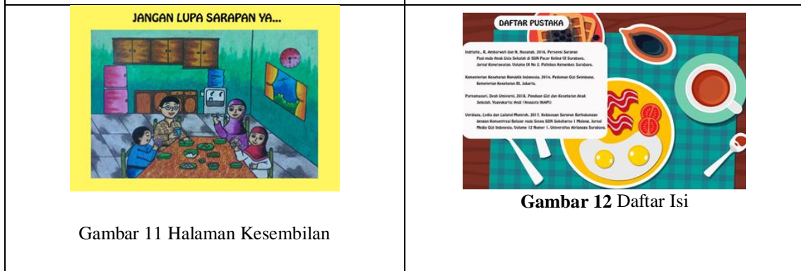
Gambar 11 Halaman Kesembilan