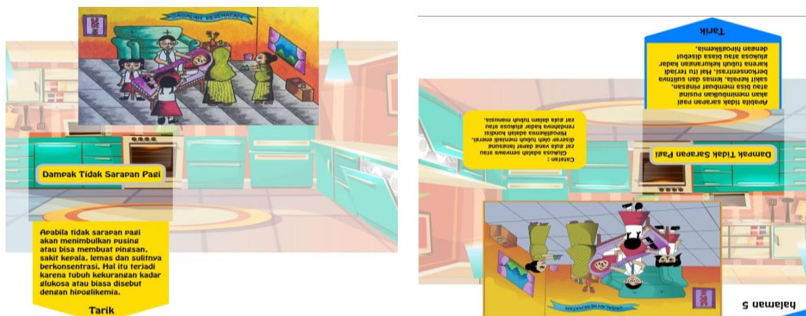
Gambar 13 Design media pop up book sebelum dan sesudah direvisi

Penambahan keterangan pada kata-kata yang kurang dimengerti responden (seperti kata-kata glukosa dan hipoglikemia). Penggunaan kata glukosa dan hipoglikemia merupakan kosakata yang baru bagi anak sekolah dasar, sehingga ahli materi menyarankan untuk menambahkan keterangan untuk menjelaskan kata glukosa dan hipoglikemia. Menurut Rahmawati (2014) Kosakata adalah kata-kata yang memiliki makna sehingga dapat dimengerti dan digunakan dalam menyusun kalimat baru yang akan disampaikan pada orang lain. Selain itu menurut penelitian Halisah (2018) mengatakan bahwa hasil masukan dari ahli bahasa untuk memperbaiki pemilihan diksi (pilihan kata) pada media pop up book , setelah pemilihan diksi (pilihan kata) diperbaiki menunjukkan bahwa pemilihan kata dengan penggunaan bahasa yang lebih sederhana dapat mempermudah pemahaman peserta didik.