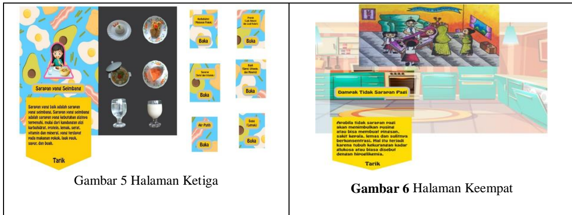
Gambar 5 Halaman Ketiga