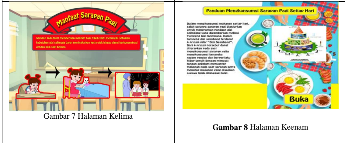
Gambar 7 Halaman Kelima