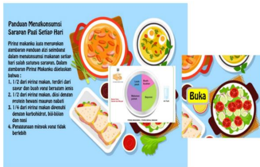
Gambar 17 Design pop up book yang terdapat kata buka