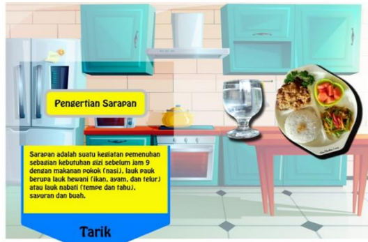
Gambar 16 Design pop up book yang terdapat kata tarik sebelum dan sesudah direvisi