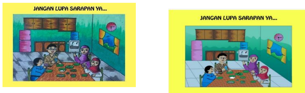
Gambar 15 Design halaman terakhir pop up book sebelum dan sesudah di revisi

Gambar ilustrasi yaitu benda kongkrit berguna sebagai penunjang keberhasilan dalam pembelajaran (Oktaviyanti, 2013) dan penelitian lain mengatakan bahwa penggunaan media gambar ilustrasi dapat meningkatkan hasil belajar siswa (Witjaksono, 2017).