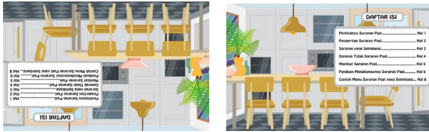
Gambar 19 Desain daftar isi pop up book sebelum dan sesudah direvisi

Berdasarkan hasil evaluasi penilaian uji validasi dari ahli materi didapatkan hasil sebesar 97,5% dengan kategori sangat baik serta tidak perlu direvisi dan hasil ahli media sebesar 88,3% dengan kategori baik dan direvisi seperlunya. Menurut Tegeh dkk (2014) penilaian ini termasuk dalam tingkat pencapaian 90-100% yang artinya sangat baik dan tidak perlu direvisi dan termasuk dalam tingkat pencapaian 75% - 89% yang artinya baik dan layak direvisi seperlunya.