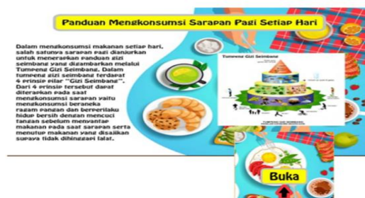
Gambar 18 Design pop up book sebelum dan sesudah direvisi